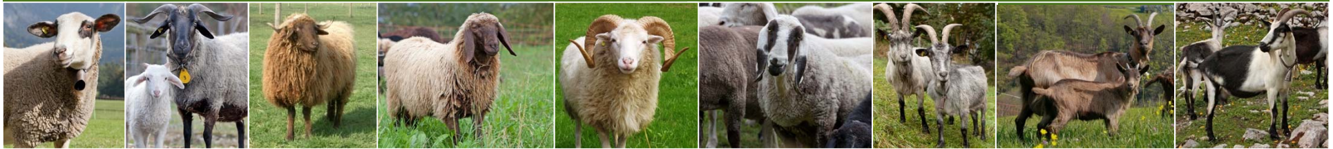
Spiegelschaf Bündner Oberländer Schaf Walliser Landschaft Engadinerschaf Skudde Saaser Mutte Capra Grigia Stiefelgeiss Pfauenziege