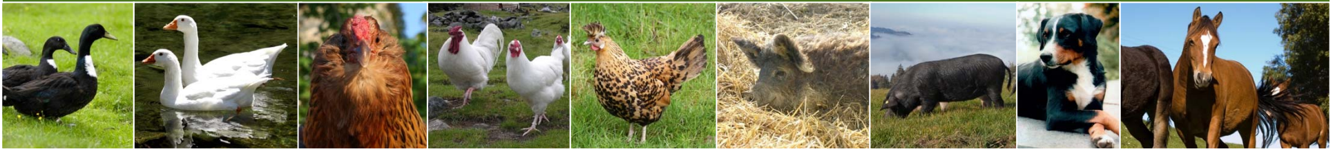
Pommernente Diepholzer Gans Appenzeller Barthuhn Schweizerhuhn Appenzeller Spitzhaubenhuhn Wollschwein Schwarzes Alpenschwein Appenzeller Sennenhund Freiburger Pferd