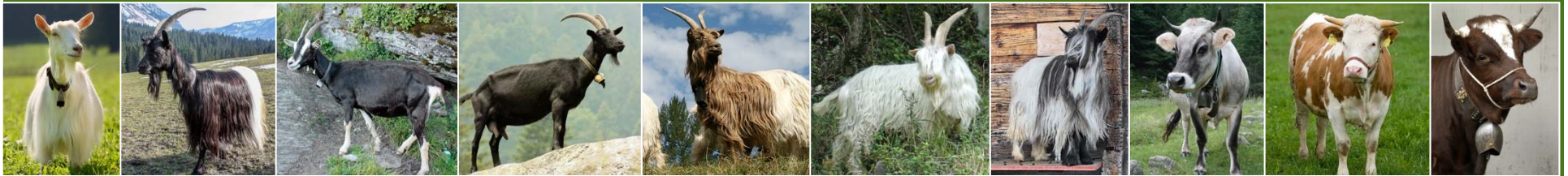
Appenz. Ziege Walliser Schwarzhalsziege Bündner Strahlenziege Nera Verzasca Kupferhalsziege Capra Sempione Grünenochte Geiss Rätisches Grauvieh Hinterwälder Rind Evolèner