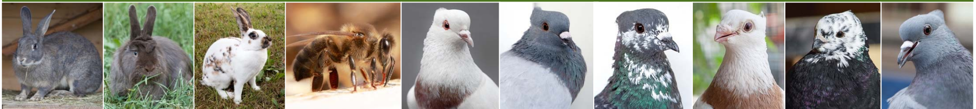
Schweizer Fehkaninchen Schweizer Fuchskaninchen Schweizer Dreifarben Kleinschrecken Dunkle Biene Thurgauer Elmer Berner Spiegelschwanz Berner Guggler Luzerner Elmer Luzerner Rieselkopf Aargauer Weissschwanz